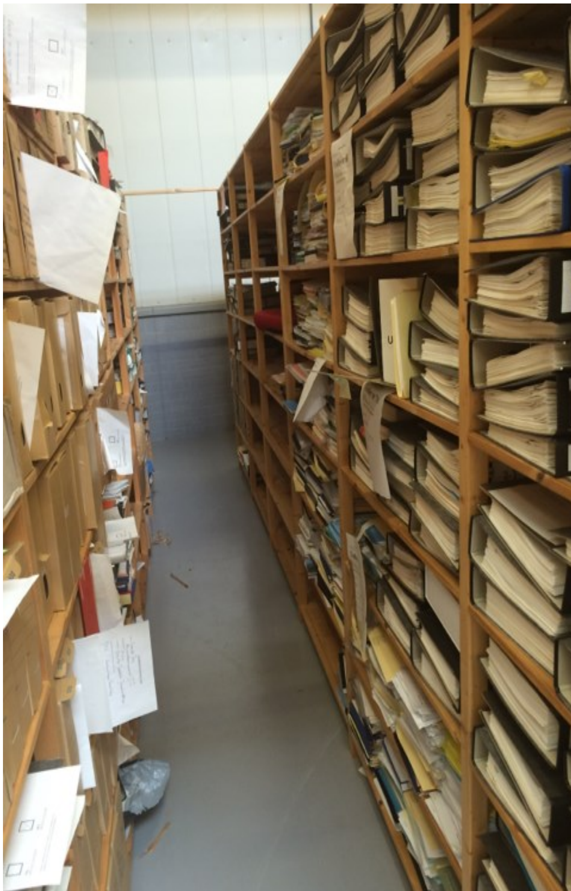
Archiefstellingen in Ypenburg, 2017 (deze foto documenteert de situatie van vóór de sluiting van Ypenburg)